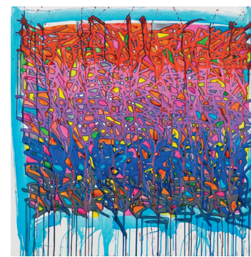
JonOne (né en 1963), Picking Pennies from da cemetery , 2008, huile et encre de Chine sur toile, 140 x 200 cm, galerie Le Feuvre, Paris VIII e , jusqu'au 20 décembre.

partie de l'exposition présente des travaux de différentes périodes en hommage à Picasso, considéré par Abad comme le plus grand peintre de toute l'histoire de l'art du XX e siècle. Sur des supports inattendus et à l'aide